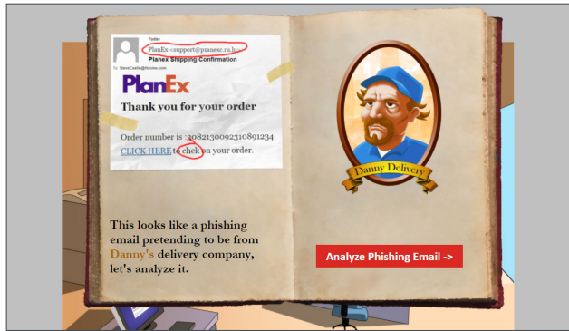
Interaktive Trainingsmodule wecken das Benutzerinteresse mit spannenden Inhalten

Über 60 interaktive Trainingsmodule klären Benutzer über verschiedene Sicherheitsthemen auf: verdächtige E-Mails, Diebstahl von Zugangsdaten, Passwortsicherheit und Konformität mit Richtlinien und Vorschriften. Die in zehn verschiedenen Sprachen verfügbaren Module sind zugleich informativ und machen Spaß – und trainieren Ihre Mitarbeiter so, dass sie auf echte Angriffe in der Zukunft bestens vorbereitet sind: